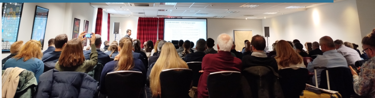
Blick in den sehr gut besuchten Saal während der Vorträge.

Freitag, den 06.02.2026 fand der dritte Internationale Tierärztkongress für Taubentierärzte in Dortmund statt.